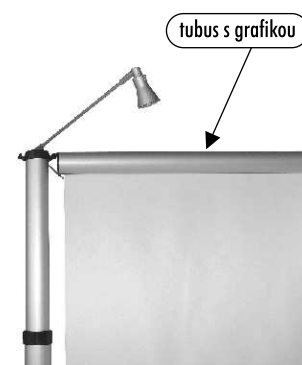
Lampa - voliteľné príslušenstvo